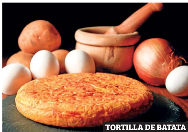
TORTILLA DE BATATA